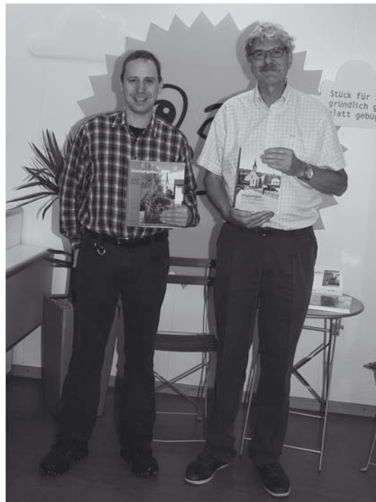
Die Bücher zur Wipkinger Geschichte sind in der Goldstück-Reinigung an der Nordstrasse 226 erhältlich.

Die Chronik der Kirchgemeinde Wipkingen, beginnend mit dem uralten Kirchlein im frühen Mittelalter am Limmatufer, dem Fraumünster-Lehen Wibichinga, dem Wachsen der Gemeinde in der Neuzeit und mit dem Bau der neuen Kirche, ist auch ein Spiegel der Entwicklung Wipkingens.